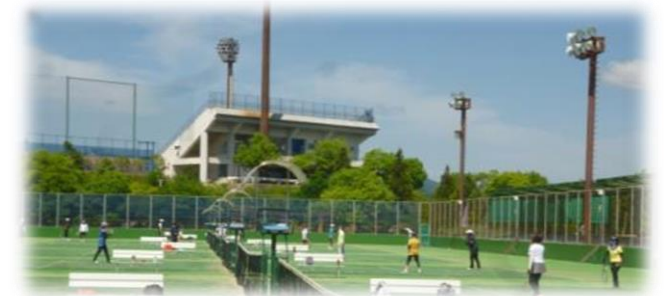
前期テニス教室の様子です。一緒に清々しい汗をかきませんか？ご参加お待ちしております！