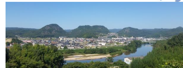
新高山城跡を眺望