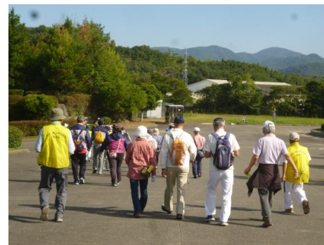
やまみ三原運動公園陸上競技場前

9月30日(土) 三原市運動普及リーダー会ご協力のもと、第2回三原さわやかウォーク2017が開催されました! 天候にも恵まれ参加者106名、やまみ三原運動公園を発着点とし、米山寺を折り返した7kmコース・10kmコースを清々しい汗をかきながら歩きました。途中、国指定史跡である新高山城跡を眺望し、折返し地点の米山寺へ到着しました!