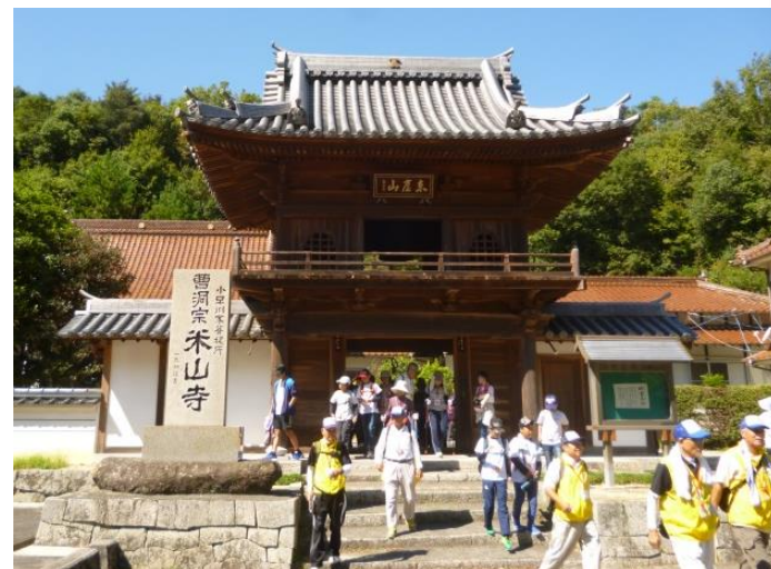
米山寺では、住職のお話を拝聴しました

米山寺は、1153年に創建された天台宗の寺ですが、小早川茂平が1235年に念仏堂を建立してから、小早川家の菩提寺となり、境内には小早川家初代・小早川実平から17代・小早川隆景までの宝篋印塔20基があり国の重要文化財となっているそうです。