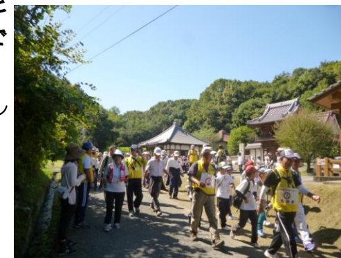
ゴールを目指して復路出発!

重要な文化遺産を見学し、ゴールを目指して全員で復路を歩きました。ゴール地点では、三原市食生活改善推進委員協議会より蒸しパンと飲み物の提供があり子どもたちも喜んでいました。参加して下さいました皆様、ありがとうございました! (^▽^)